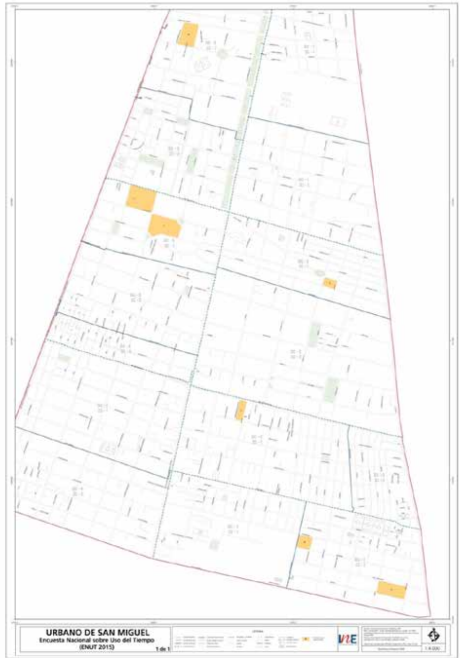
Figura n°1: plano comunal